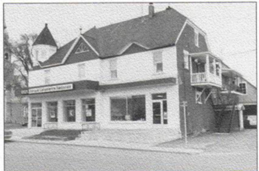
En 1974, la Banque Canadienne Nationale louait une partie de la bâtisse de la Coopérative.