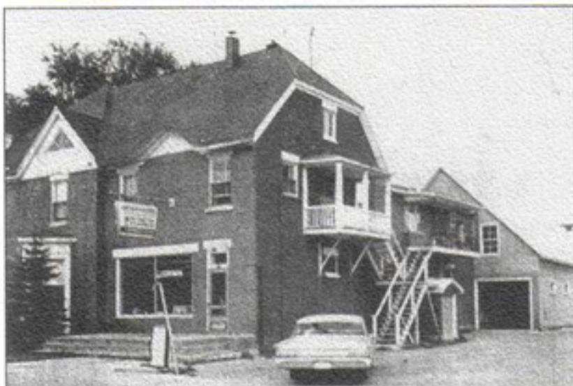
Les locaux de la Coopérative en 1967.