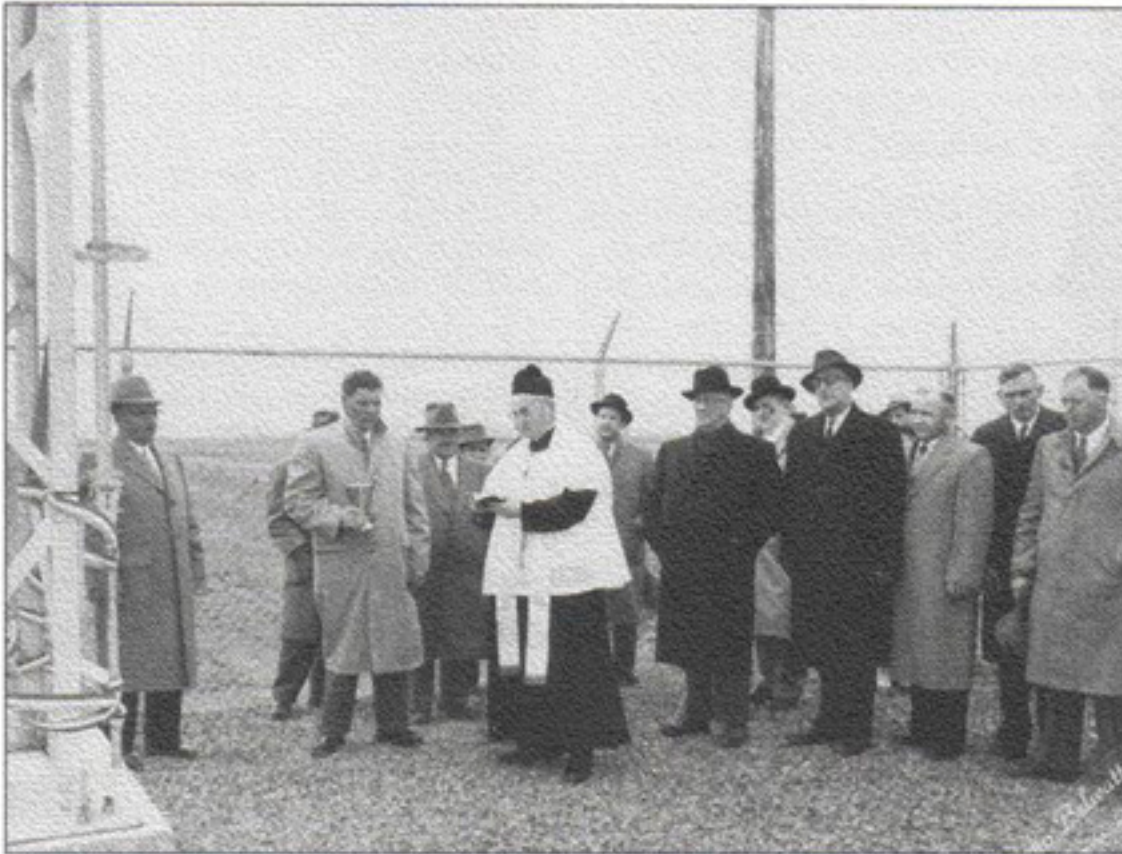
Bénédiction d'une des stations du réseau électrique.

13 avril 1957: Remplacement de la structure en bois des stations de Ste-Madeleine et Ste-Angèle par des structures métalliques.