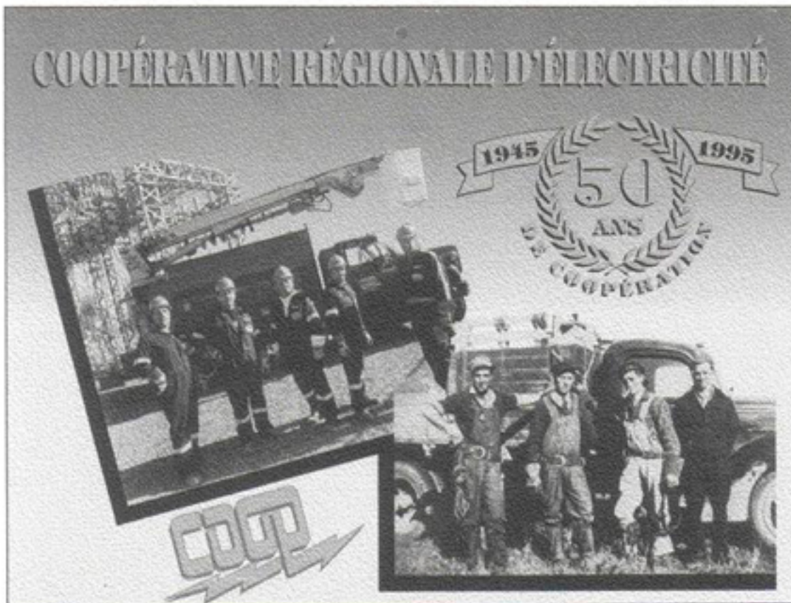
50 ans de coopération. 50 ans de progrès.

Mise en place du plan budgétaire pour le paiement des factures d'électricité. Le plan s'appelle MVE, soit le mode de versements égaux.