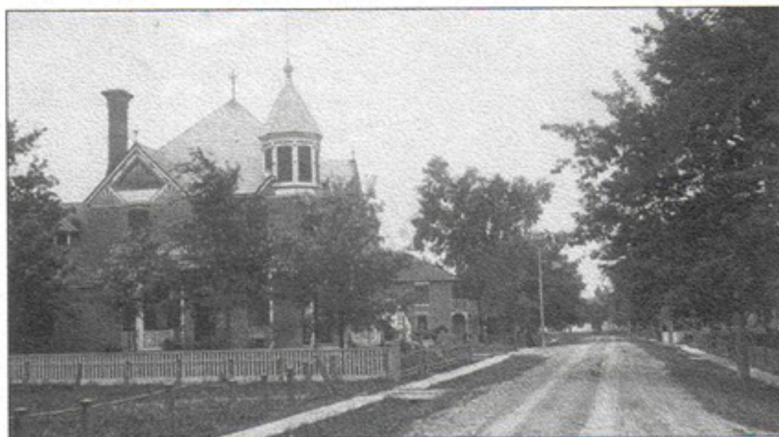
Une partie de la rue Principale en 1920. On y voit la magnifique résidence qui abrite aujourd'hui les bureaux de la Coopérative.